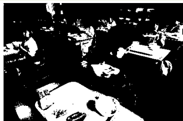
1年 はじめての給食